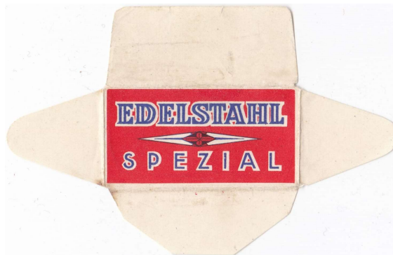
052 (100%) E230