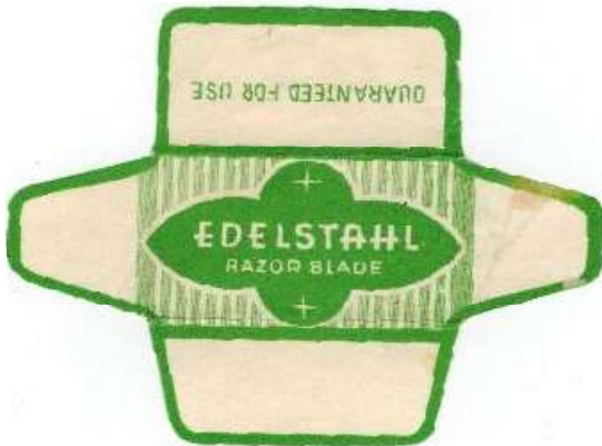
051 (100%) E235