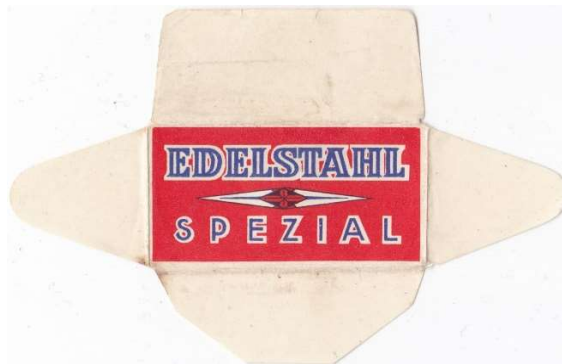
064 (100%) E230