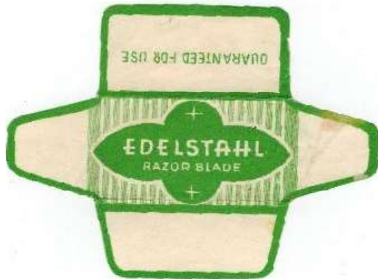
063 (100%) E235