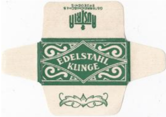
EDELSTAHL 043 E190