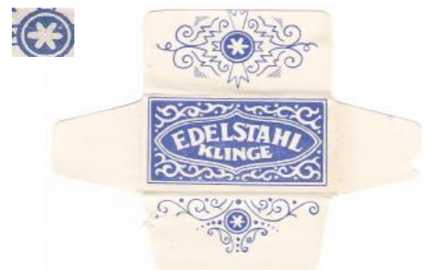
100% EDELSTAHL 025