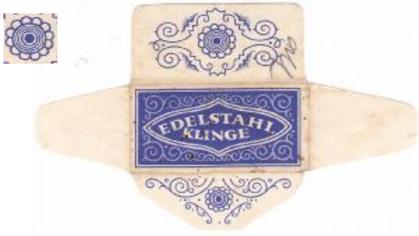
60% EDELSTAHL 021