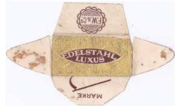
EDELSTAHL 052 E230