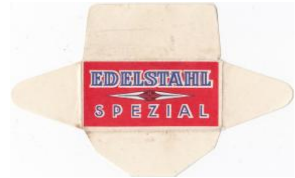
EDELSTAHL 052 E230