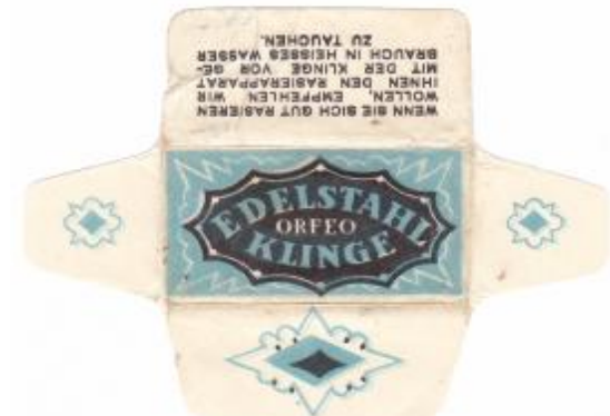
EDELSTAHL 052 E230