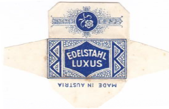
EDELSTAHL 051 E235