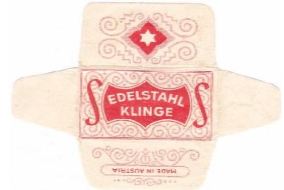
EDELSTAHL 052 E230