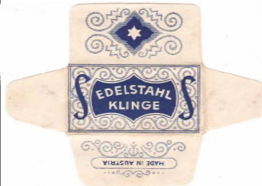
EDELSTAHL 051 E235