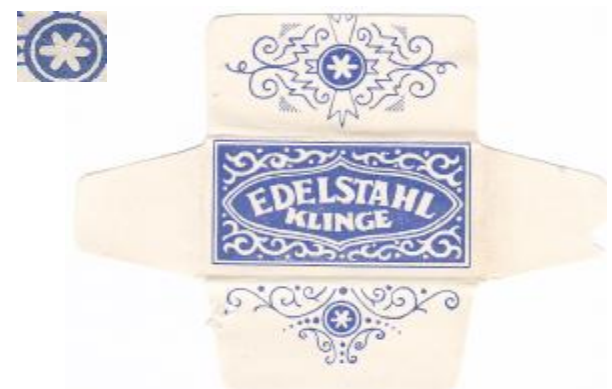
100% EDELSTAHL 025