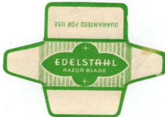
EDELSTAHL 051 E235