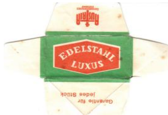
EDELSTAHL 051 E235