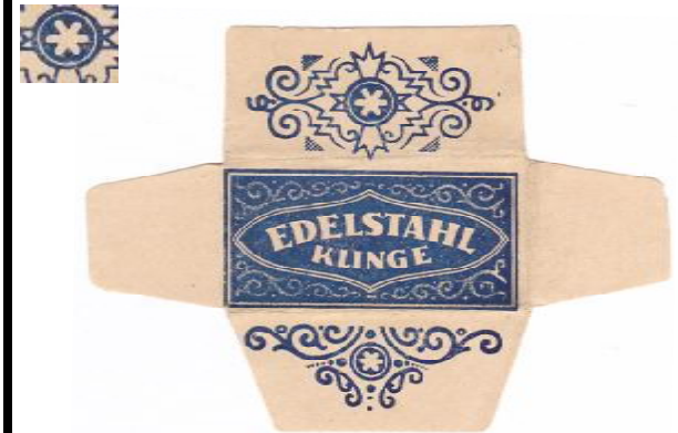
100% EDELSTAHL 022