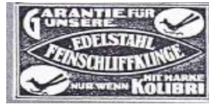
EDELSTAHL 056 E052