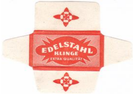
EDELSTAHL 050 E253