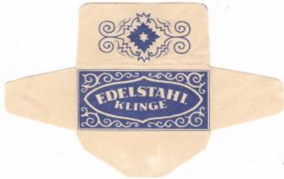
75% EDELSTAHL 037