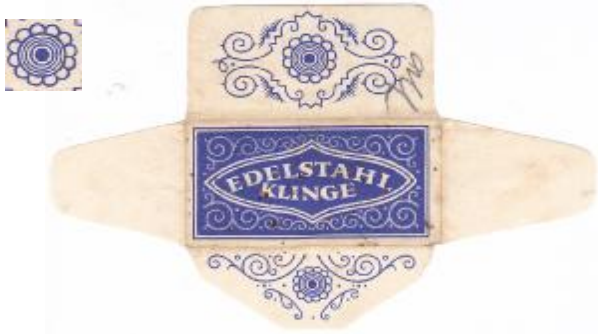
60% EDELSTAHL 021