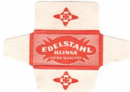
EDELSTAHL 050 E253