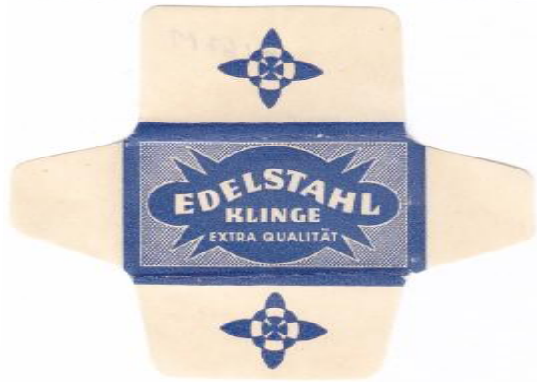
EDELSTAHL 049 E250