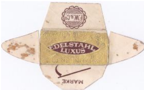
EDELSTAHL 052 E230