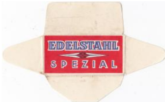
EDELSTAHL 052 E230