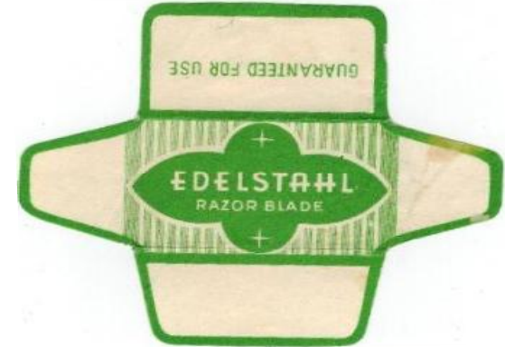
EDELSTAHL 051 E235