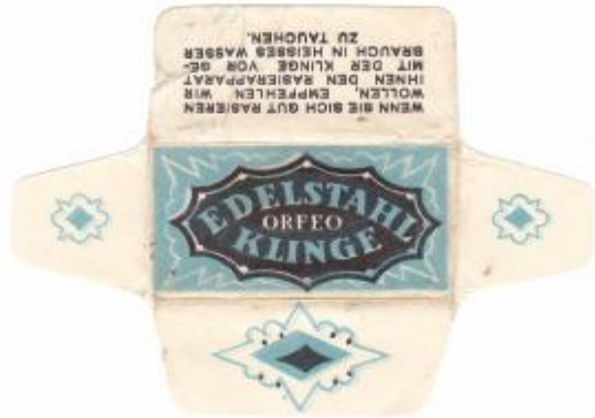
EDELSTAHL 052 E230