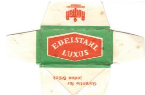
EDELSTAHL 051 E235