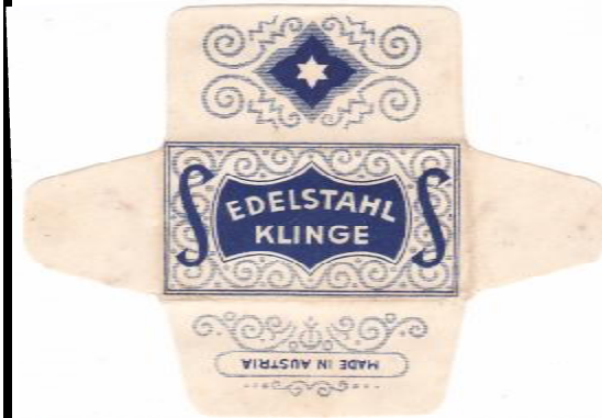
EDELSTAHL 051 E235