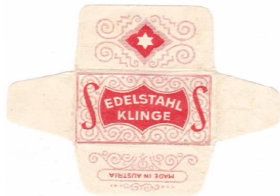
EDELSTAHL 052 E230