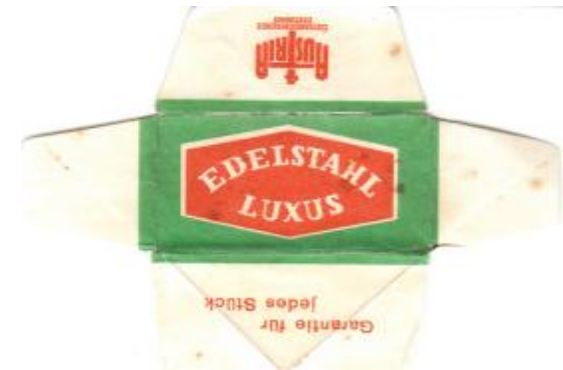
EDELSTAHL 051 E235