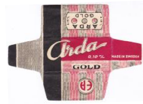
TURKEY - FAKE