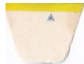
GRAPHIC MARK AR (big)