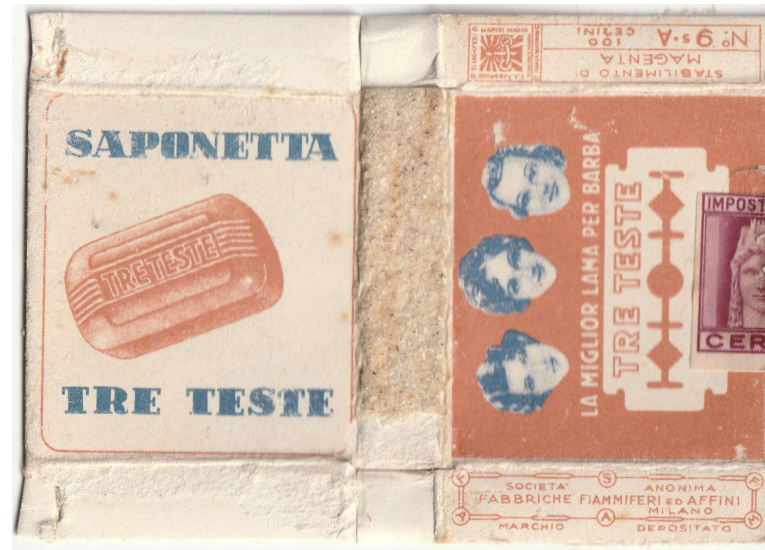
TRE TESTE 09

I - ITALY FABBRICHE FIAMMIFERI ED AFFINI S.A.F.F.A. stab. di MAGENTA