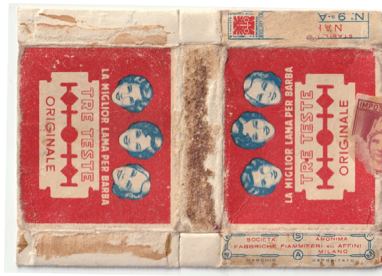
TRE TESTE 06

I - ITALY FABBRICHE FIAMMIFERI ED AFFINI S.A.F.F.A. stab. di MAGENTA