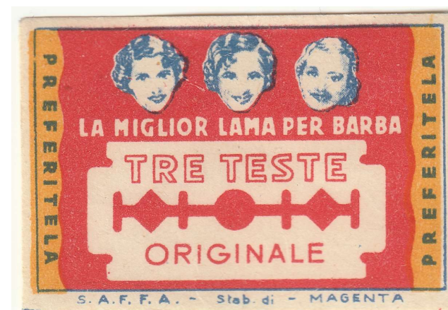
TRE TESTE 01