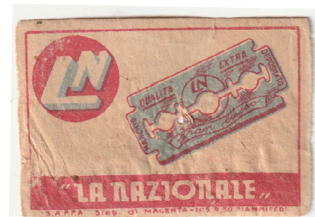
LA NAZIONALE 01