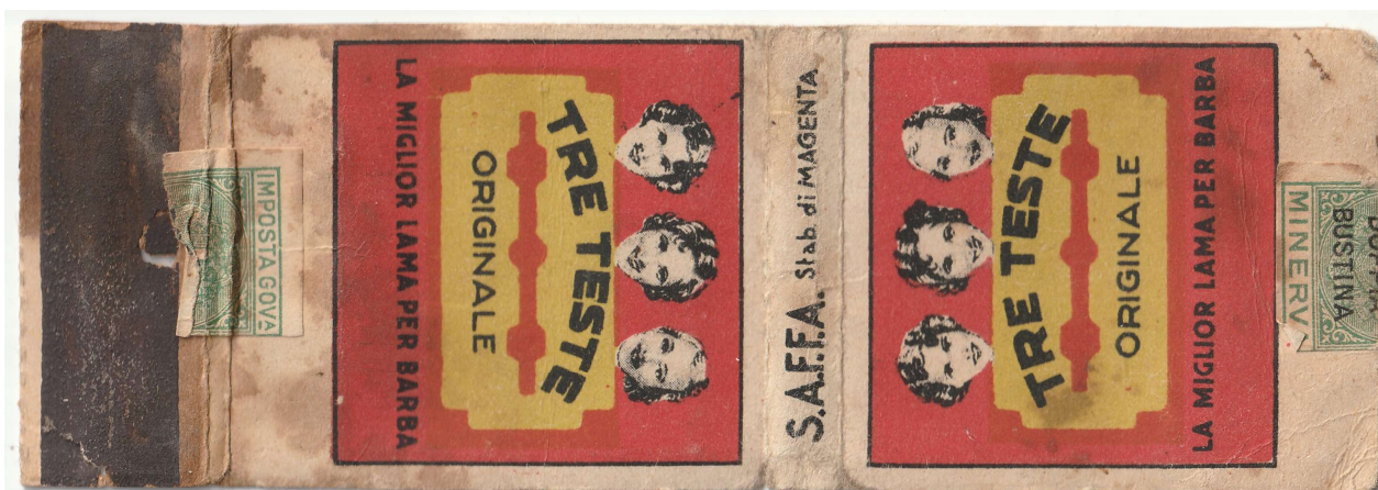
TRE TESTE 05