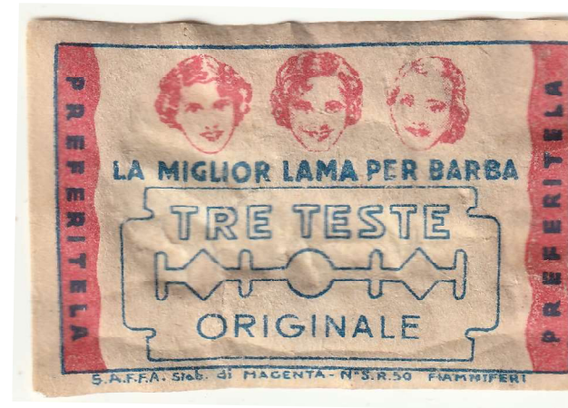
TRE TESTE 02