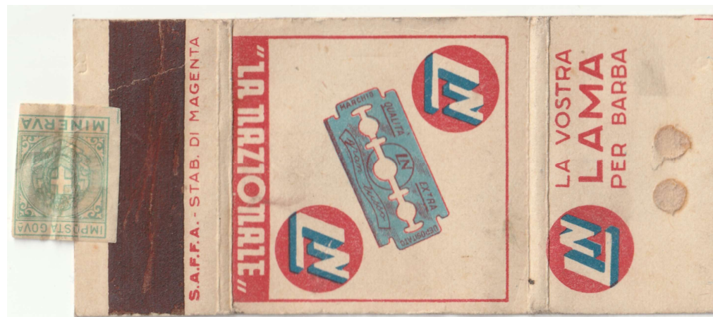
LA NAZIONALE 03