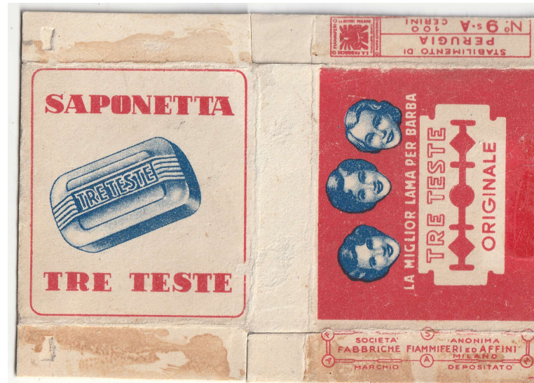
TRE TESTE 08

I - ITALY FABBRICHE FIAMMIFERI ED AFFINI S.A.F.F.A. stab. di MAGENTA