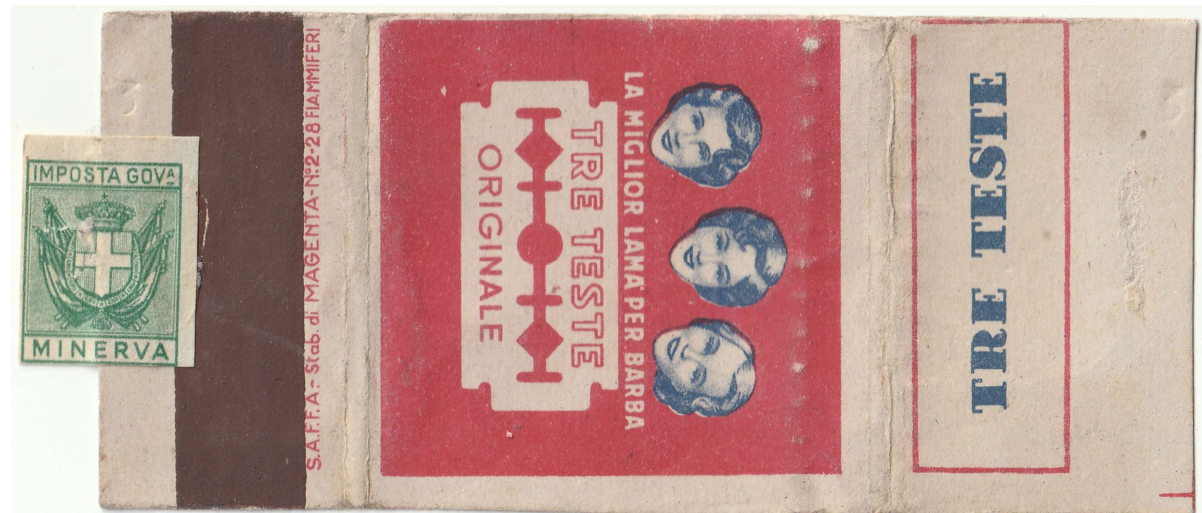
TRE TESTE 03