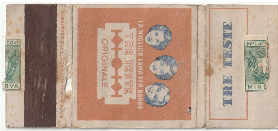
TRE TESTE 04