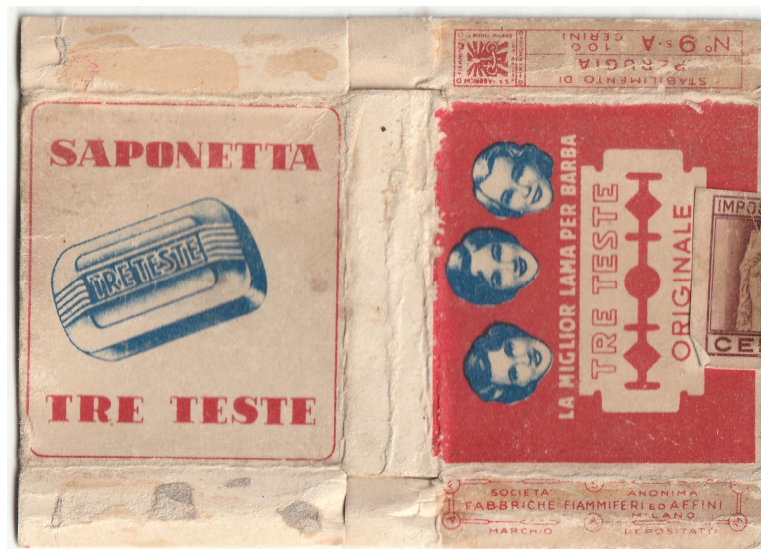
TRE TESTE 07

I - ITALY FABBRICHE FIAMMIFERI ED AFFINI S.A.F.F.A. stab. di MAGENTA